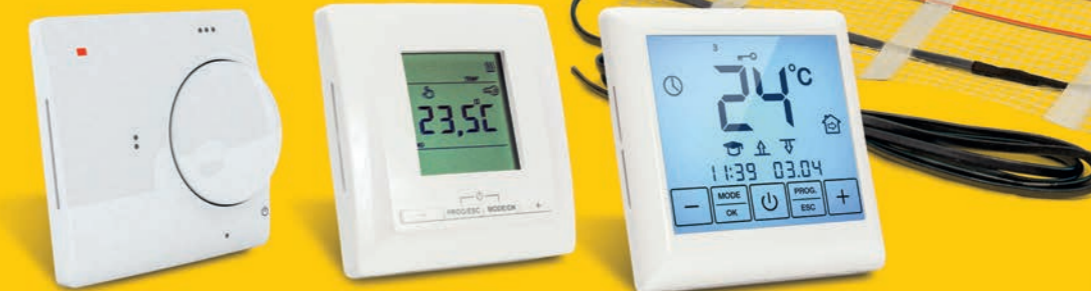
Kemmler TS1 Regler analog